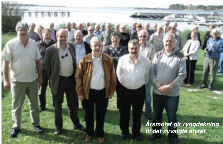
Årsmøtet gir ryggdekning til det nyvalgte styret.

Tekst: Geir Werner