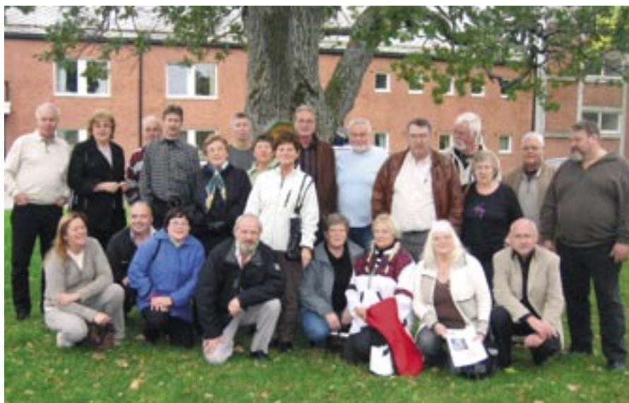
Deltakere på likemannskurset.

Landsforeningen for Arbeidsmiljøskadde (ALF) i Sør-Trøndelag har egen sang som brukes på medlemsmøter og kurs.