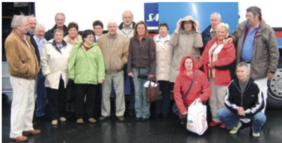
Glade "turister" på jubileumstur med Hurtigruten.

I forbindelse med at A.L.F Sør-Trøndelag fyller 20 år, inviterte vi våre medlemmer med på en tur med Hurtigruten fra Trondheim til Harstad tur/retur. Vi ble 19 stykker som dro av gårde lørdag 16. september på morgenen i et aldeles strålende høstvær.