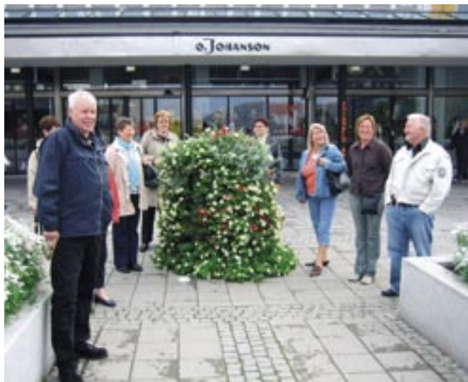
Bodø torg i full A.L.F-blomst.

Etter en natt med hyppige anløp oppover Lofoten, ankom vi Harstad tidlig mandag morgen.