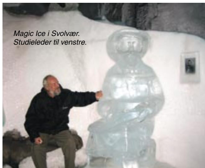
Magic Ice i Svolvær. Studieleder til venstre.

Etter Sortland og Stokmarknes, hvor vi var innom Hurtigrutemuseet, gikk turen inn i Raftsundet som er en naturopplevelse.