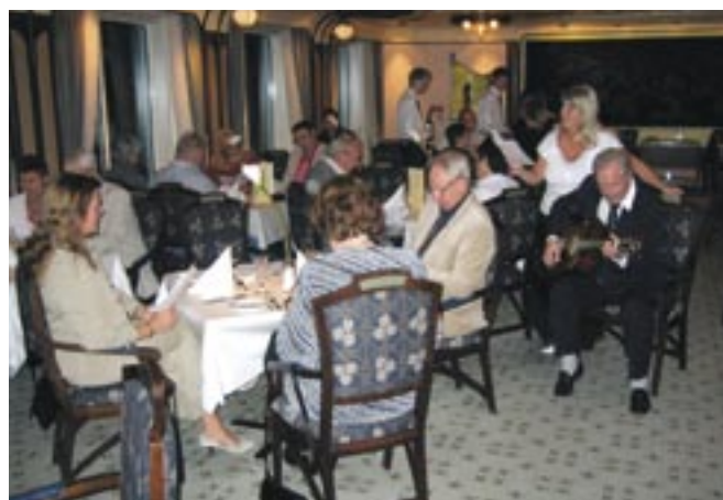
Fra jubileumsmiddagen med allsang.

ekstranummer fikk vi avsluttet en fantastisk middag, og vi inntok baren som hadde et enmannsorkester på plass. Siden gikk denne lørdagskvelden sakte "inn i dimman" som svenskene sier.